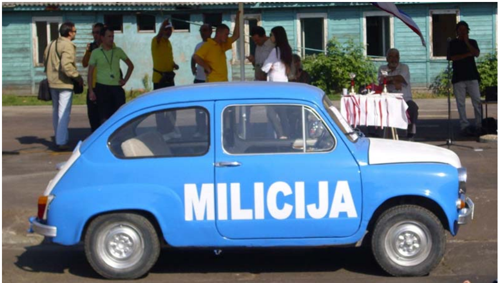
Image 1. The police fića at 2011 Fićijada in Kragujevac.

Accounts of people’s engagement with the ‘state’ in socialism often tell a story of bad faith, or to put it better, bad reciprocity. Workers in the factories, as well as communities marginalized from the centres of political life, it has been argued, understood the moral ambiguities of their ‘second economy’ activities – such as looting, lifting, theft and favours – in an overall context in which the state was not fulfilling its own obligations. Seen as suspicious, alienating and exploitative, the ‘state’ and its property were dealt with in an interpretative framework of mutual