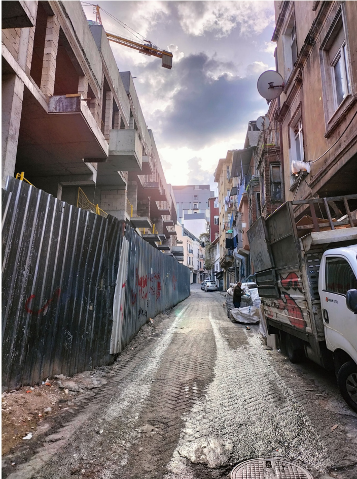
Image 2: Areas of Tarlabası where urban transformation remains incomplete. October 2023

The ongoing threat of eviction and policing continues to shape everyday life in ways that exemplify the neoliberal politics of urban governance, in which regeneration projects reconfigure land use while erasing oppositional and marginal socialities (Ünsal 2014). Ethnographically, Tarlabası reveals how these dynamics are enacted through diffuse practices regulating access to housing and services, simultaneously producing categories of insiders and outsiders. Residents frequently reported that humanitarian initiatives were constantly overshadowed by sudden police raids, arrests, and deportations, illustrating how support and control coexist in shaping daily life.