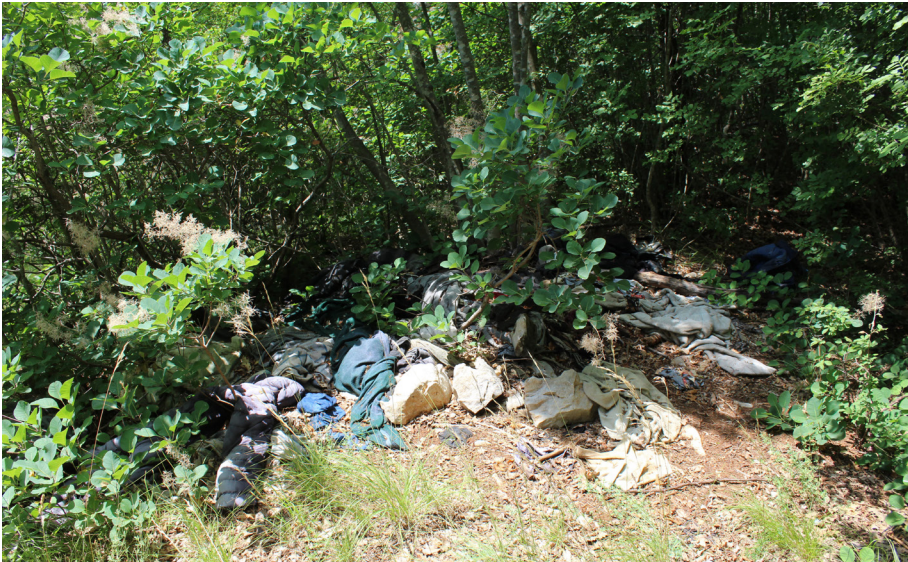
Image 1: Material traces of migration in the border forest of the Municipality of San Dorligo della Valle. Municipality of San Dorligo della Valle, 11 July, 2025.

ever, she stressed that she does not understand the abandoned material traces as an expression of disrespect, but rather as a consequence of differences in learned habits. She emphasized that this becomes particularly evident after several days of walking through forests, when fatigue and practical circumstances outweigh concern for keeping the space clean. Image 1 shows a dumping site of a larger number of material traces, which the interlocutor repeatedly described during the conversation with the word roba . She also explained that the objects were collected in a pile as part of a forest clean-up campaign, which was organized by the nearby village exclusively due to the villagers' desire to remove large quantities of material that was burdening and polluting the natural environment.