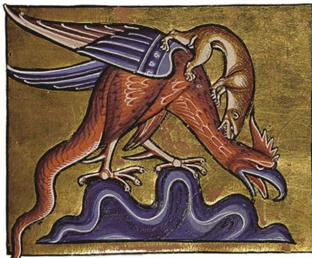
Сл. 1 – Базилиска напада ласица, минијатура из Абердинског бестијарија, почетак XIII века

Услед веровања да се излеже из петловог јајета, базилиск је од почетка XIII века познат под именом basilecoc , како је најпре наведен у бестијарију односно Књизи о животињама Пјера из Бовеа или Петра Пикарђанина. И овај аутор описује његово излегање из јајета које израста у утроби петла након што напуни седам година, на коме лежи крастача. Након што се излегне, он има главу и тело петла, али му је реп као у змије. Пошто је изузетно отрован, погледа који усмрћује, једини је начин да се он убије помоћу кристалне посуде кроз коју човек може да га види, али не и он њега. (Mélanges 1851, 213–214). У тадашњим и познијим бестијаријима, базилиск је визуелно приказиван на овај начин – са главом, телом и крилима петла, али змијским репом.