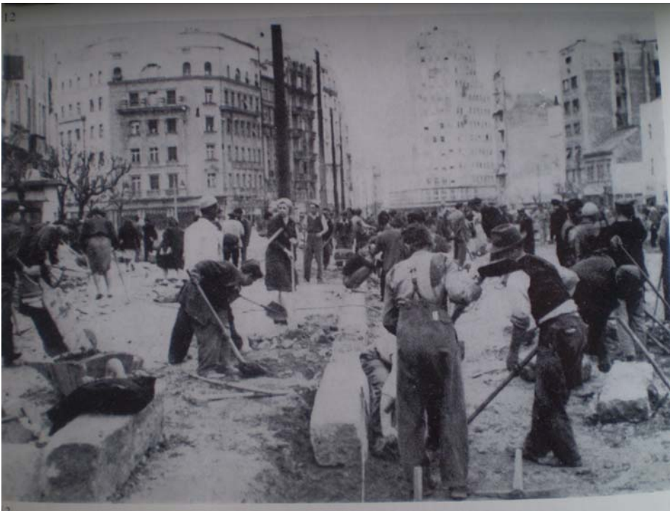
Сл. 1. Радна акција на Теразијама 1947. године. Фотографија објављена у: Историја Београда 3. Двадесети век. Београд: Просвета, стр. 560.

На левој обали Саве, између Старог београдског сајмишта делом порушеног у рату, и рукавца Дунава, 1947. године почињу припремни радови на изградњи Новог Београда (Ристановић 2009, 226). Средином 1948. године израђена је прва идејна скица (на подлози 1:10000) генералног решења саобраћаја и намена површина „Великог Београда“ са Београдом, Новим Београдом и Земуну (Добровић 1957, 425-439). Поред овог генералног решења предложена су и нека идејна решења за специфичне и важне амбијенталне комплексе: Ташмајдан, Калемегдан, Теразијску терасу, Трг Републике, Славију, Светосавски плато, Савски амфитеатар итд.(Стојановић 1970: 201-236).