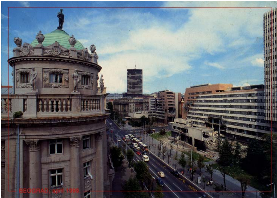
Сл. 4. Комплекс зграда познат као Добровићев Генералштаб снимљен одмах након НАТО бомбардовања 1999. године.

Године 1965. постаје редовни члан САНУ, а Реферат Одељења за ликовну и музичку уметност о Николи Добровићу потписали су Александар Дероко, Петар Лубарда и Станојло Рајичић (Добровић 1967, 88-97)