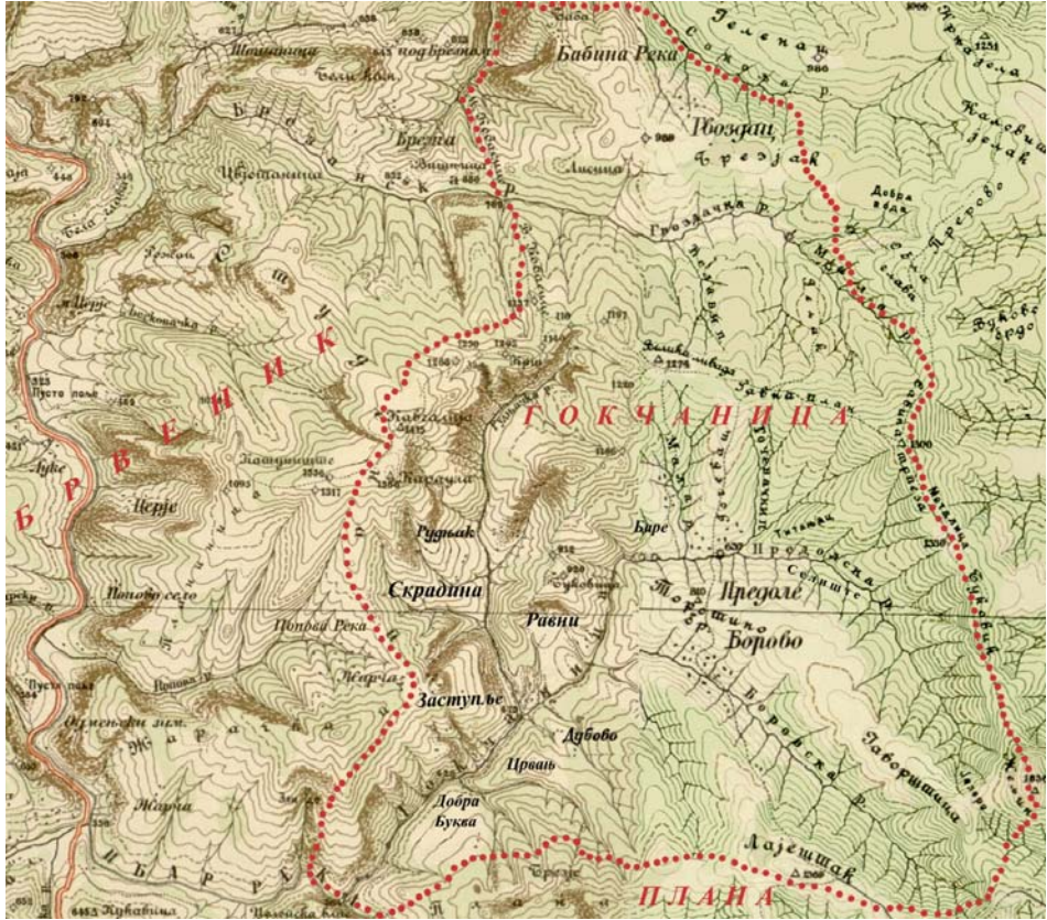
Нахија Гокчаница 15–18. век 31

симболичних 1000 акчи. Она је представљала право на експлоатацију гвожђа и није мењана у зависности од производње. 30