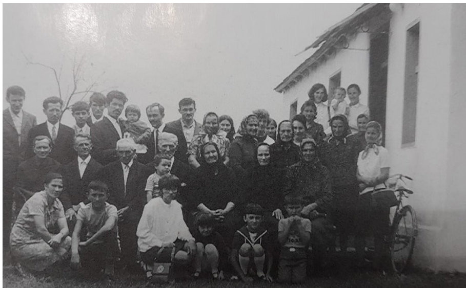
Фотографија бр. 4 – Вјерници из Ламинаца испред првог молитвеног дома у држави.