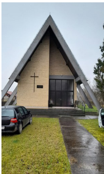
Фотографије бр. 5 и 6 – Адвентистички молитвени домови у Ламинцима и Ножичком. (28. јануар и 20. август, 2023. године)

Било је случајева да су адвентисти због превелике потражње били приморани да примају шегрте како би продукција била ефикаснија. Помоћни радници су обично били такође припадници заједнице, а понекад чак и чланови породице, најчешће браћа или синови. На овај начин би адвентисти „спасили“ друге припаднике заједнице проблема са којима би се могли суочити радом у државним преду-